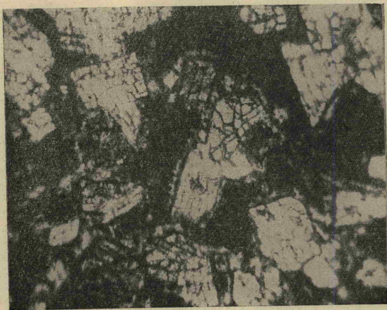
Рис. 2. Обр. 507. Кристаллы пироксена в слабо измененной основной массе с перекристаллизованным карбонатом. P=25 кбар, T=1100-900^{\circ}\text{C} , \times 100 , ник. ||.